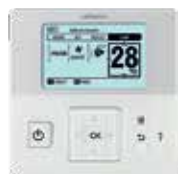
sterownik przewodowy standardowy z programatorem tygodniowym